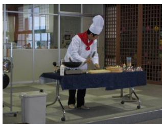
コックさんの衣装をつけて

玩具のピアノを使ってのベートーヴェンのピアノ協奏曲や、台所用品を使つての「キッチン・コンチェルト」、様々な年齢層にあわせた「音楽