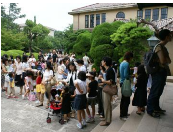
開場前からたくさんのお客様

七月七日(土)、本学講堂にて「子どものためのセタコンサート」(子どものためのコンサート・シリーズ第十回)を開催いたしました(第一部・十一時〜、第二部十五時〜、来場者数九六五名)。