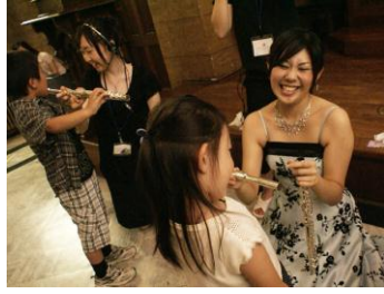
フルートを吹いてみよう！

それぞれが自分たちの出している音を曲と共に楽しんでる様子でした。終演後はおなじみの楽器体験コーナーです。コンサートで使った楽器（フルート、ヴァイオリン、ピアノ、チェレスタ、トーンチャイム）を実際に体験してもらいました。子どもたちは、楽器から音が出た瞬間その音にびっくりしたり、コンサートで歌った《きらきら星》を弾いてみたりと、楽しそうに目を輝かせていました。また、そんな子どもたちを見ていると、私たちも音との出会いの大切さを改めて感じました。