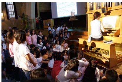
聴くだけでなく、じっくり観察

講堂の二階にある大オルガンで演奏している姿を舞台上のスクリーンに映したところ、普段見る事のできないオルガン奏者の奮闘ぶりを目の当