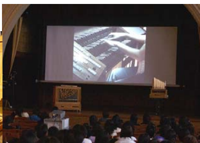
演奏の様子をスクリーンで!