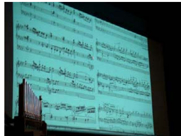
オルガンの楽譜は3段です

ズなども取り入れ、オルガン音楽の魅力をたっぷり味わってもらえるよう工夫しました。