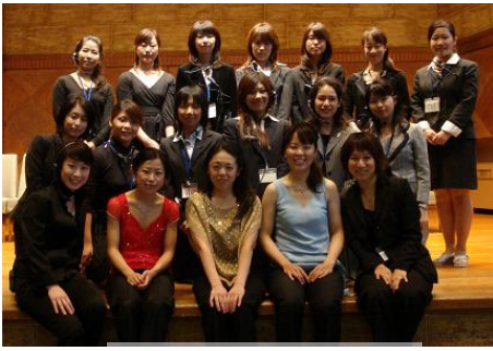
出演者、スタッフ一同