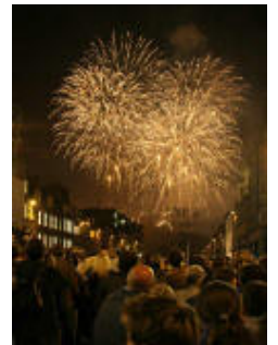
エディンバラの花火

まず、ロンドンから二十四日朝一番の飛行機でエディンバラの北外れにある聖コランバス・ホスピスに直行し、尺八で日本の曲、またフルートでイギリスの曲を中心に、ホスピスの入居者の方々と共に演奏したり歌ったりできるコンサートをしました。その後バスを乗り継ぎ、東外れにある、プロスペクト・バンク・スクールへ直行しました。ここは発達障害のある子どもが多く通う小学校で、前日突然その学校の先生から「子どもたちは、ミッシェン・インポッシブルが好きですので、どうぞよろしく」と要請があったため、コンサート前に生徒の中から数名を集め「ミッシェン」と称して他の生徒には内緒で手作り楽器を作り、コンサート最後のその生徒たちを中心に《聖者の行進》を合奏しました。